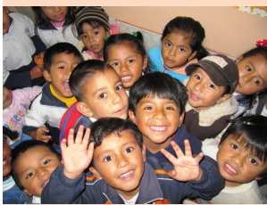
Niños del Centro de Desarrollo Infantil Caritas "Alegres"

El servicio de Educación de ASA está destinado a los niños, niñas, y adolescentes de los barrios Rancho Alto, La Planada, Colinas del Norte, Corazón de Jesús Cotocollao, Carcelén Alto, Carcelén Bajo, Carapungo, Luz y Vida al Norte de Quito.