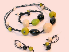
Conjunto GERMANIA Collar, aretes y pulsera Tagua y algodón