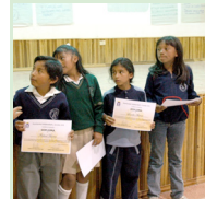
Niños y niñas representantes al Consejo Consultivo de Quito CAE Guadalupe

El 25 de junio ASA celebró sus 16 años de vida institucional con un acto realizado en la Parroquia San Lucas en Carcelén Bajo, en el que participaron los colaboradores, socios, amigos y representantes de INFODESARROLLO y el CONFIE, organizaciones aliadas.