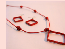
Conjunto SOFÍA Collar y aretes Alambre de cobre reciclado