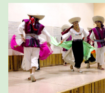
Ballet Folclórico Casitagua

Participaron también el Grupo Folclórico de los compañeros de Talleres de ASA y el Ballet Folclórico Casitagua, de Colinas del Norte.