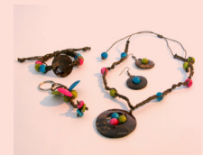
Conjunto ELIZABETH Collar, aretes, pulsera y llavero Tagua, algodón y coco