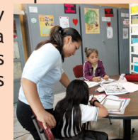
Biblioteca Atenas Luz y Vida

Uno de los efectos positivos que tiene dar educación de calidad en barrios urbano marginales, es garantizar el ejercicio pleno de uno de los derechos primordiales de los niños niñas y adolescentes, y de esta manera ofrecer a todos servicios con condiciones adecuadas.