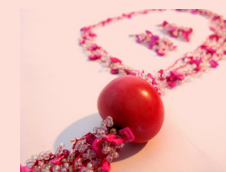
Conjunto CLAUDIA Collar y aretes Tagua y chaquiras